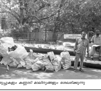
നഗരസഭ പഴയ ചെറുപ്പകുട്ടികൾ കണ്ണാടി മാലിന്യങ്ങളും ശേഖരിക്കുന്നു.