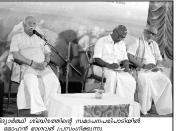
പ്രോഗ്രാമിന്റെ വിദ്യാർത്ഥികൾക്ക് സമാഹരണപരിപാടിയിൽ.