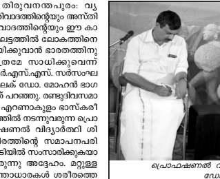
ഡോ. മോഹൻ ഭാഗവത് പ്രസംഗിക്കുന്നു.